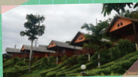
ภาพจาก ภูชี้ฟ้าโฮมสเตย์