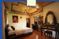
ภาพจาก ภูฟ้าธารา รีสอร์ท