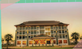
ภาพจาก โรงแรมแกรนด์วิว