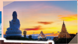
วัดห้วยปลากั้ง