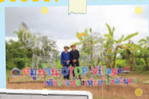
สถานี โป่งศรีนคร