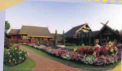
พระตำหนักดอยตุง Doi Tung Royal Villa