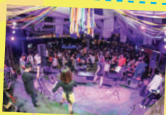
ภาพจากโสด Sing