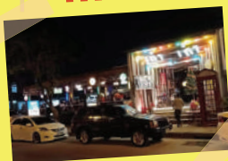
ภาพจากเก่า เก่า