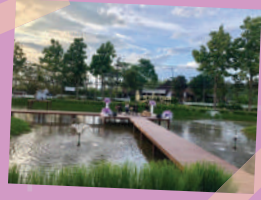
ภาพจากทำนัฎแล