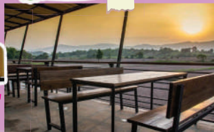
ภาพจากจุกึ่งเผา