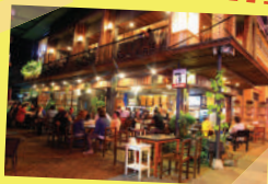
ภาพจากเชียงรายรำลึก