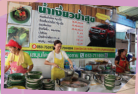
ภาพจากน้ำเงี้ยวป่าสุ