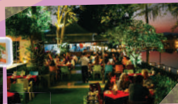
ภาพจากลีลาวดีเชียงราย