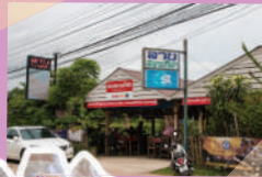
ภาพจากลาบสนามกีฬา