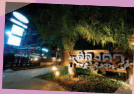
ภาพจากสลุงคำ