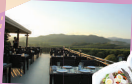
ภาพจากภูภิรมย์