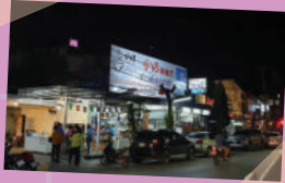
ภาพจากข้าวต้มจ่าอี