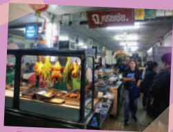
ภาพจาก จ.เจริญชัย