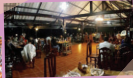
ภาพจากบ่อกึ่งบ้านสวน