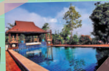
ภาพจาก ไร่เกษตร ภูแพรวา