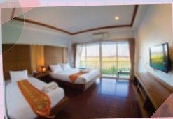
ภาพจาก สบาย @เชียงใหม่