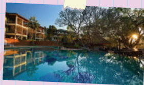
ภาพจาก บ้านเช่าการ์เด็น แอนด์ รีสอร์ท