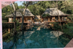
ภาพจาก โฟร์ ซีซั่นส์ เต็นท์ แคมป์

Four Seasons Tented Camp ตั้งอยู่บริเวณสามเหลี่ยมทองคำ ติดกับชายแดนพม่า หากที่เข้าพักจะได้นั่งเรือหางยาวเพื่อเข้าไปยังรีสอร์ท ห้องพักที่นี่เป็นเต็นท์หรูที่ตั้งอยู่กลาง ป่า สิ่งสำคัญที่ไม่ควรพลาดในการมาพักที่นี่คือการขี่ช้าง และฝึกบังคับช้าง