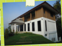
ภาพจาก เชียงของวิลลส์ แอนด์ รีสอร์ท